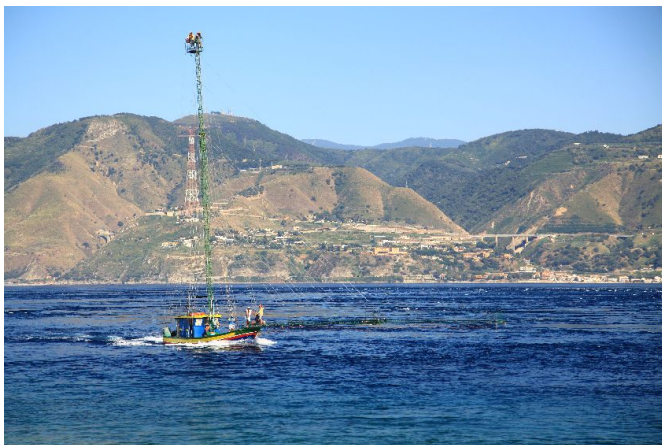
bateau de pêche dans le passage de la Messina

Les tourbillons et les courants sont très impressionnants, ainsi qu'une rencontre avec les pêcheurs locaux qui tentent d'attraper des poissons d'épée de leurs bateaux de pêche, est une expérience unique. En outre, les ferries qui font constamment la navette entre le sud de l'Italie et de la Sicile. Vous pouvez accoster dans le port de plaisance de Messine. Les plus beaux quartiers de la ville sont situés autour de la cathédrale.