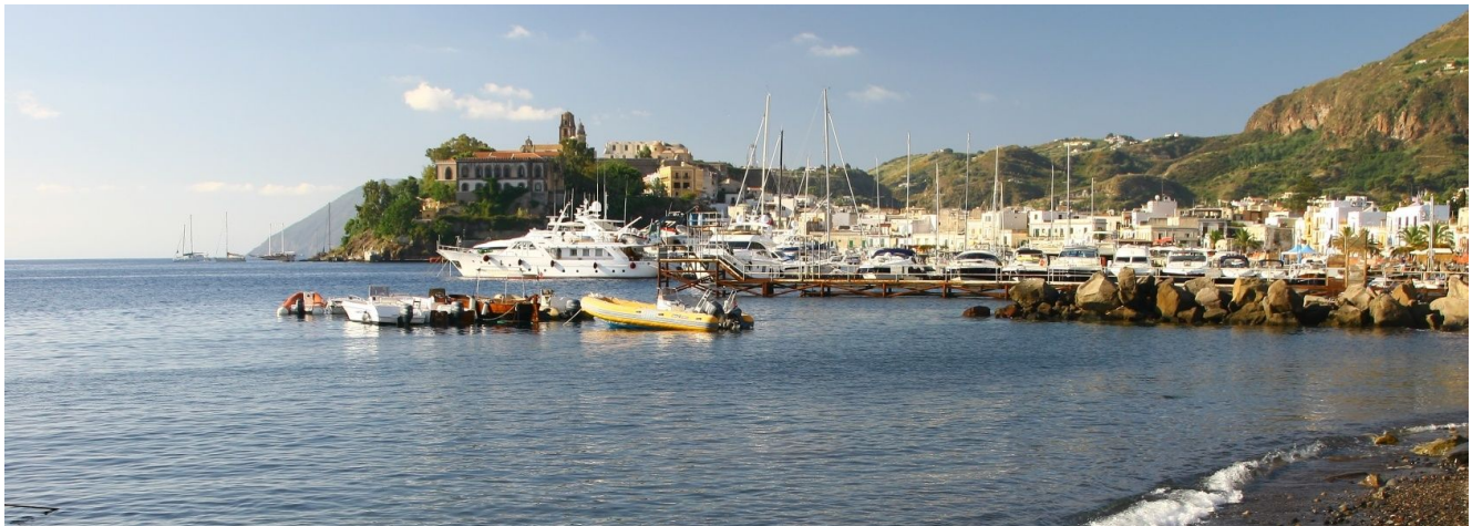
le port de Lipari